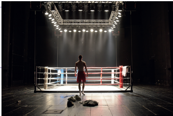
Rocco und seine Brüder

ROCCO UND SEINE BRÜDER NACH DEM FILM VON LUCHINO VISCONTI INSZENIERUNG: SIMON STONE WITH ENGLISH SURTITLES PREISE M 1. ABO DI GELB / GRÜN