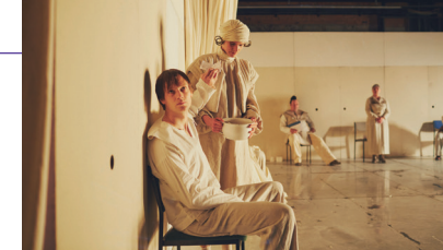
Mutter Courage und ihre Kinder

20 UHR OPA ÜBT EIN AMBITIONIERTES OPERNPROJEKT VON FUX PREISE D